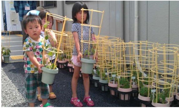
●被災地復興支援活動 東日本へのアサガオプレゼント