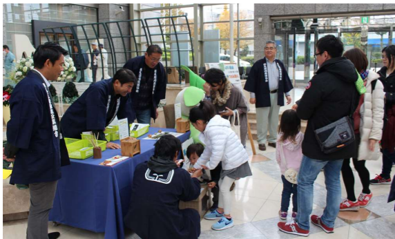
●造園技術普及啓発活動 マルシェ、ガーデニングショーの開催